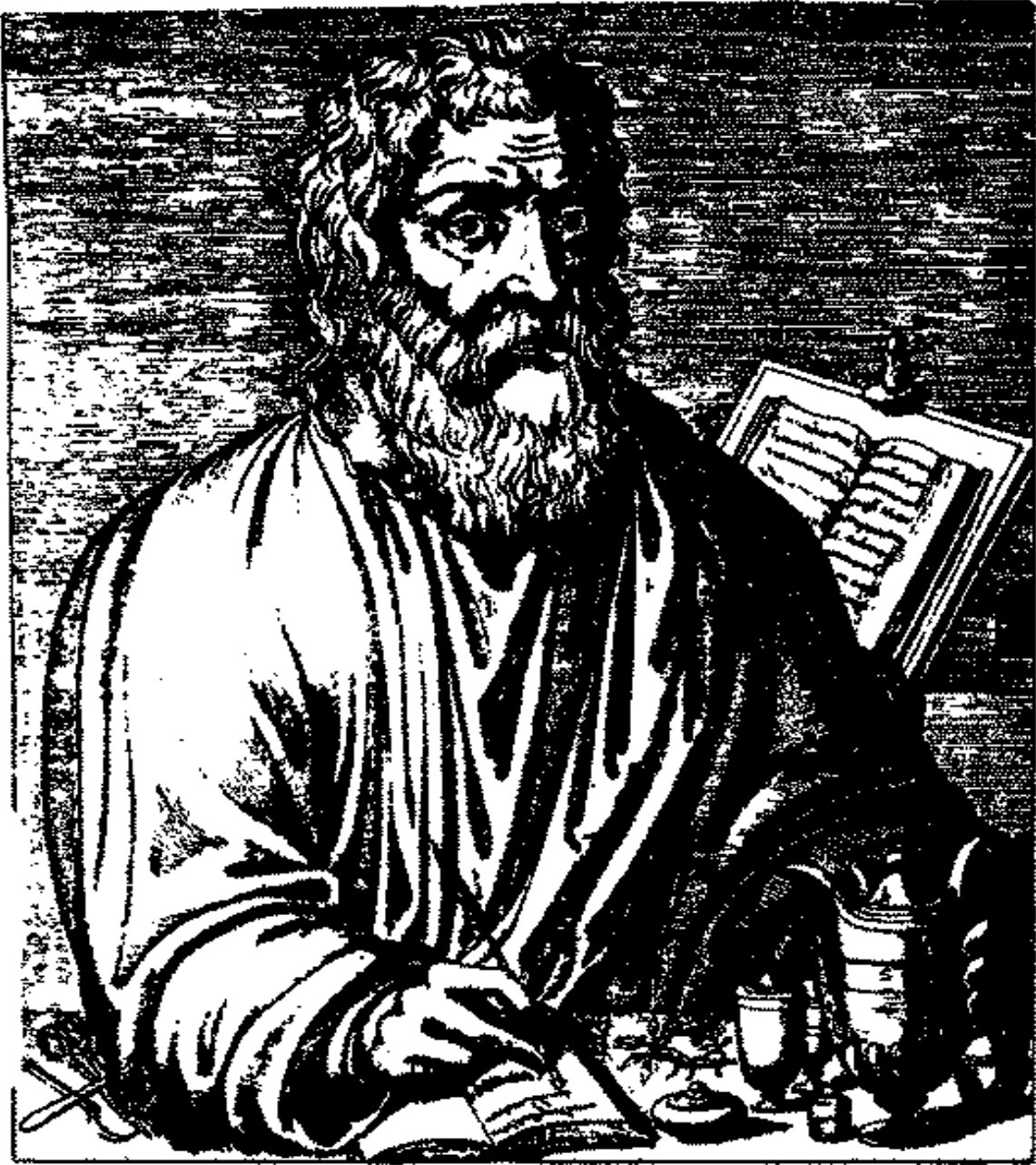
١ - أبو قراط ، كان يعالج مرضاه بتمرير يديه .